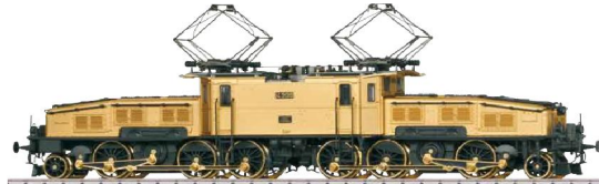
Ce 6/8 II version OR 1200.00 frs