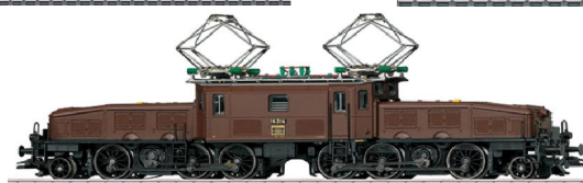
Ce 6/8 II brune 564.00 frs