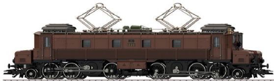
Ce 6/8 I 695.00 frs